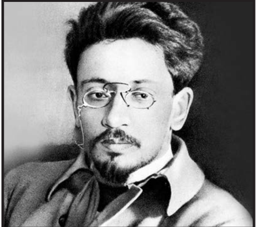
места циркулярная директива Оргбюро ЦК за подписью Свердлова о проведении геноцида... расправа обрушилась на тех казаков, которые уже покорились, уже признали Со- ветскую власть...».